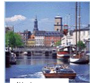
Abb. oben: Stadtrundfahrt in Kopenhagen